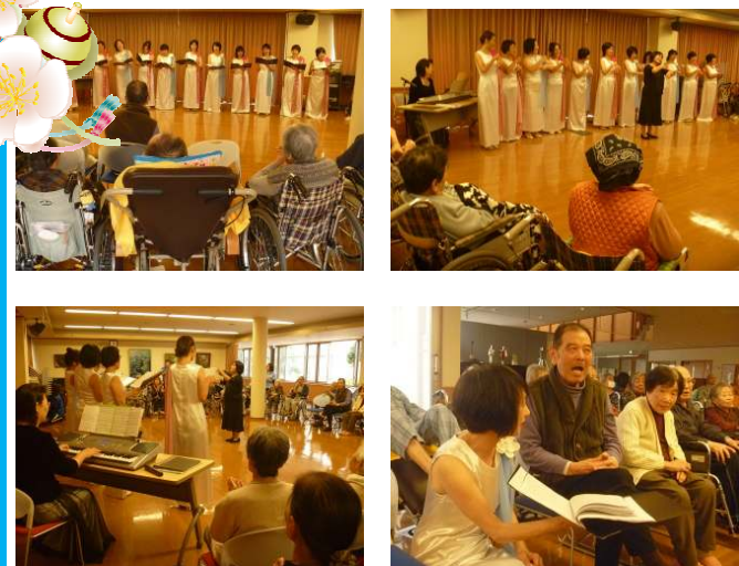
麻里布小学校PTAコーラスの方々による合唱の披露がありました。入居者の皆様も一緒に唱和されて楽しい時間を過ごすことが出来ました。

この他にも行事等のボランティアを募集しています。詳しくは施設までお問合せ下さい。