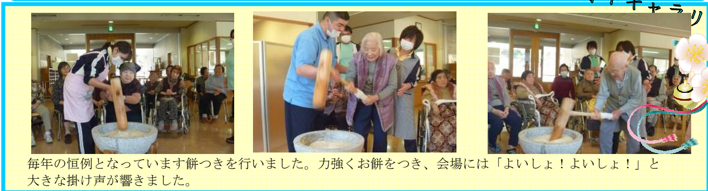
毎年の恒例となっています餅つきを行いました。力強くお餅をつき、会場には「よいしょ！よいしょ！」と大きな掛け声が響きました。