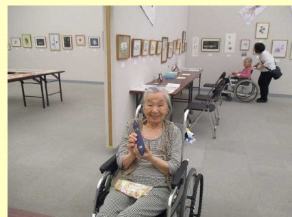
絵画教室で作られた入居者様の作品を観に展示会へ行って来ました。 ご自身の作品を前にご満悦の様子でした。